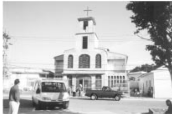
Paróquia do Senhor do Bonfim – Engenheiro Pedreira