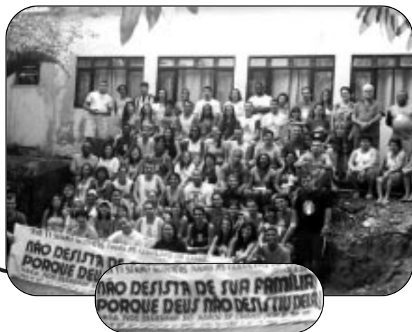
Foto: 1º Reciclagem do Movimento Juvenil - 2005

Um forte abraço! Secretariado do Movimento Juvenil www.movimentojuvenil.hpg.com.br