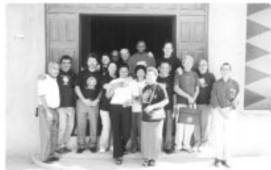
Visita a Engenheiro Pedreira