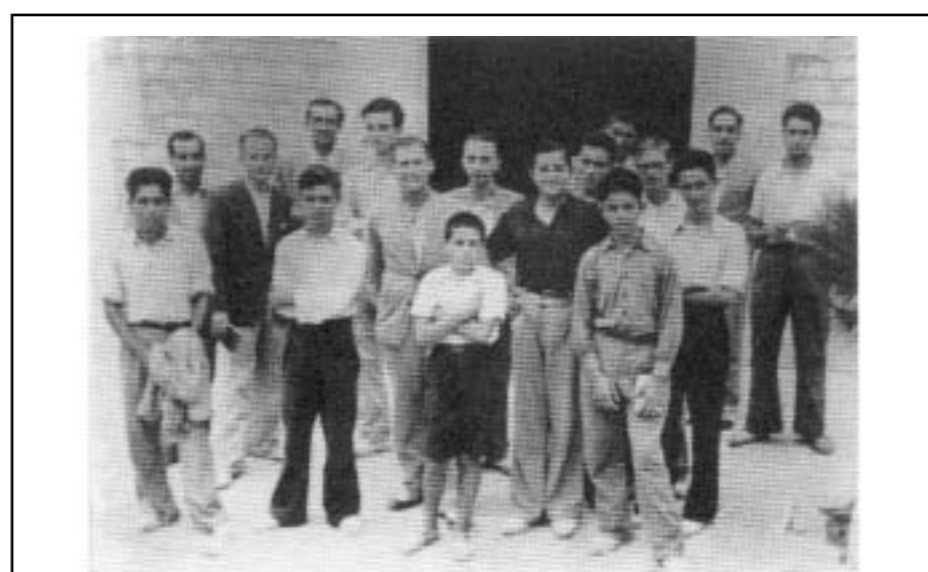
Foto 2. Primer Cursillo de Cristiandad en Cala Figuera, agosto de 1944.